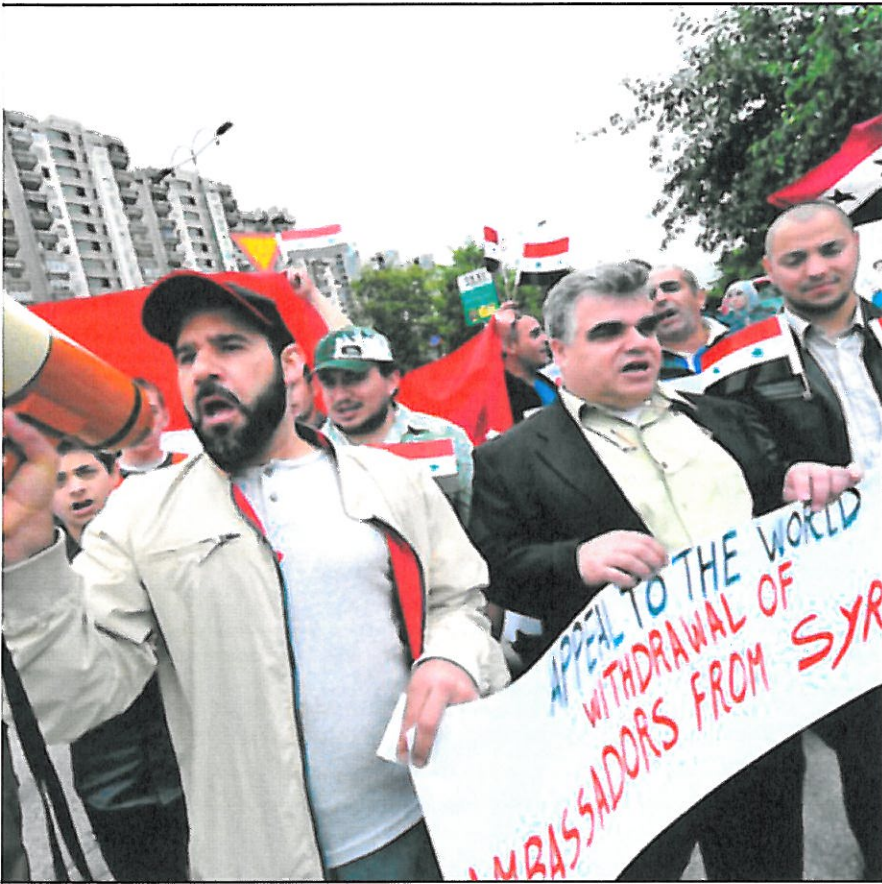
ber verden trekke ut ambassadorene sine fra Syria.